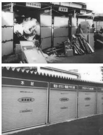
(写真) 上が、改善前の「ゴミ置き場」 下が、改善後の「資料置き場」

これをきっかけに、当社の排出物処理の取り組みに、見学申し込みが殺到しました。(つづく)