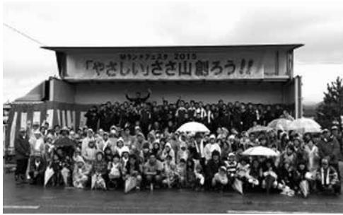
(669・2436 兵庫県丹波篠山市池上569)

挨拶が飛び交い笑顔が増え、インストラクターとゲストが学び合っています。教習所内の雰囲気が変わっていきましました。ゲストも増えてきて、「人」として成長できる教習所」へと変わっていつているように思います。