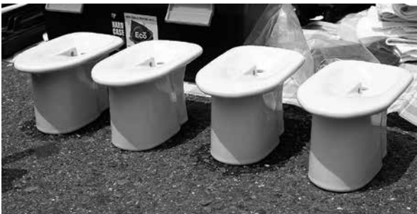
尿こし 掃除後(左) 掃除前(右) 第1回(2015.6.13)

「トイレ清掃中」に文句をいうお客様もおられました。が、そんな言葉ごと綺麗にしてやるぞという気