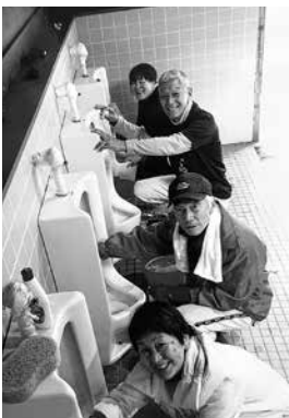
(879 1507 大分県速見郡日出町豊岡 6069 52)