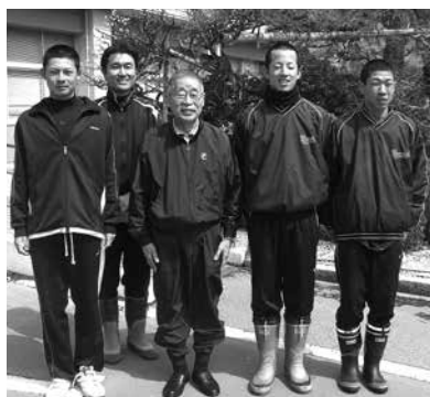
野球部員とトイレ掃除

教室掃除については、先生方は素晴らしいやり方をお持ちだと思っています。私のやり方は、自分の実験から作ったもので、「小さいことでも、自分で見つけたやり方が一番役に立つ。自信と余裕をもって伝えられる」私が教室掃除から学んだことです。