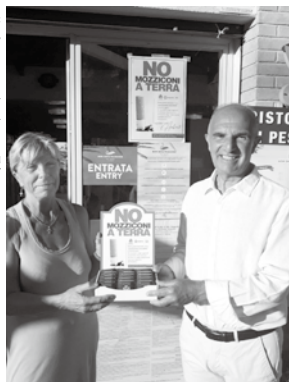
浜辺の店主(左)に、配布する灰皿を手渡す市長

2020年は、イタリアのすべての市長が参加するテレビ番組に、ペスカーラ市長カルロ・マシが応じ、市内全域で路上灰皿の数を増やすことにしました。既