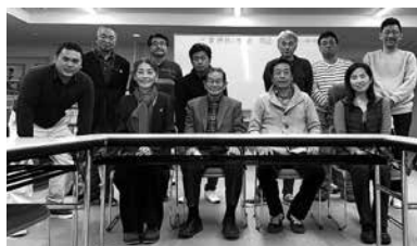
2021年度総会 (2021年11月28日) みえ市民活動 ボランティアセンター