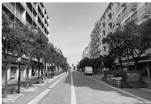
ペスカーラの街並み