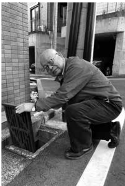
（2018年8月） 神奈川県横浜市神奈川区泉町2-6-2F 社会福祉法人いずみ

私にできることは、掃除で環境を整え、その人々の心の荒みをなくすことです。地域から日本、そして世界が、SDGsによる持続可能な平和を願いつつ…。