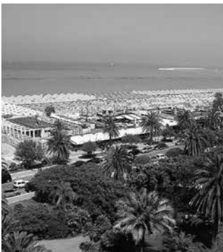
美しいペスカールのビーチ

1985年にフランスで誕生 した世界で最も歴史ある環境認 証の一つ。厳しい基準をクリアし たビーチに与えられ、これを受け たビーチは国際的に第一級と認 められたことになる。日本では鎌 倉由比ヶ浜、福井県若狭和田、神 戸市須磨、千葉県山武市本須賀 の4か所。(Wikipedia)