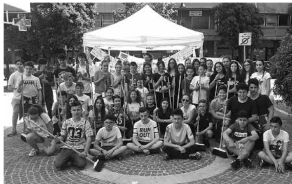
ペスカールを清掃した中学生