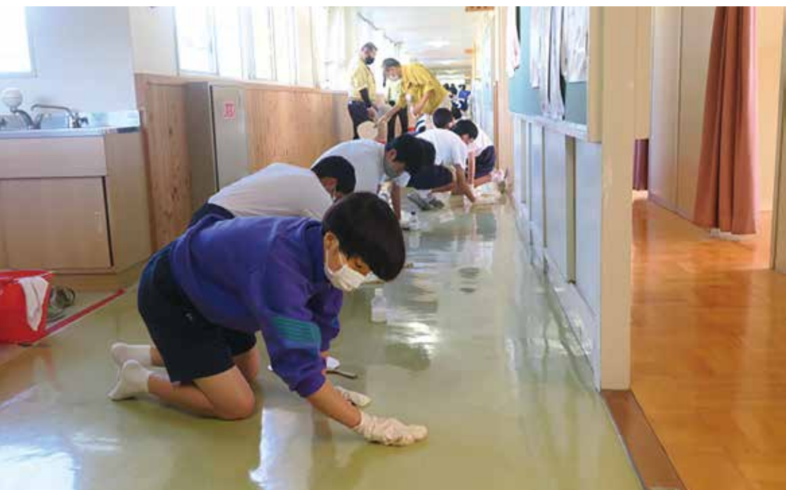
ピッカピカ廊下みがき (2021.10.16) 岐阜県恵那市立明智中学校