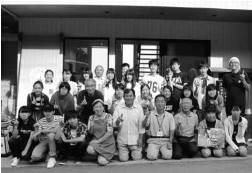
民宿「めぐろ」に夫妻を囲み

がいを感じます。私は、患者さん一人ひとりの体験や語りを大切にする看護師になりたいと思います。まだまだ未熟ですが、この活動で得たことを忘れず、生かされている命に感謝しながら、精一杯努力していきたいです」