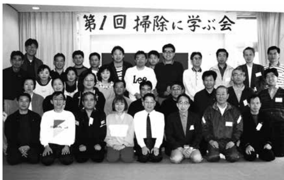
第一回大正村掃除に学ぶ会