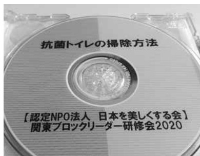
価格 1200円/枚(送料込み)

白鳥宏明副会長による、新型コロナウイルス感染予防対策の注意事項と、最近増えてきた抗菌トイレの掃除方法など。