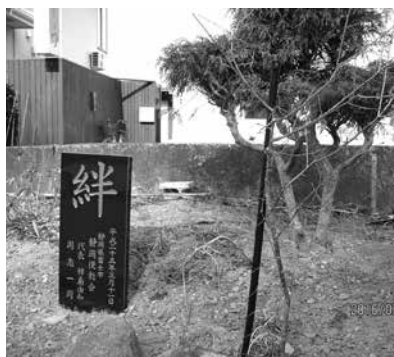
フジザクラと石碑「絆」

2回目は10月、後輩、富士市立高校生徒会長の3人で、東京掃除に学ぶ会の活動に参加。山形の会と合流し、家財運び出しと土砂掻き出しを行いました。