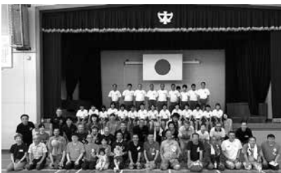
2019年(令和1)中国ブロック大会

掃除に熱心な教師を「変わり者」と見るのではなく、多くの教師に掃除の価値を理解してもらえれば、教師の指導力と感化力が向上し、生徒の素直な心が育ち、校風が劇的に変わります。掃除のない教育は、教育という看板を掲げた「教育もどき」といえるでしょう。