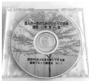
価格 1200円/枚(送料込み)