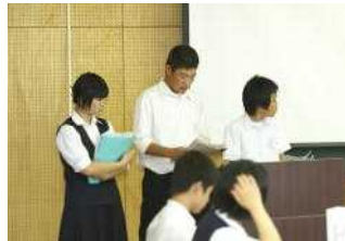
豊野中美化部三役による発表