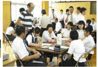
先生方も入って本気の意見交換