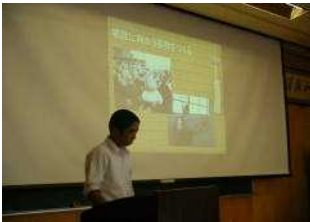
篠ノ井東中整美委員長の発表