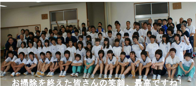
お掃除を終えた皆さんの笑顔、最高ですね!

私は、7月28日に高山中学校で行われた「清掃サミット」に参加しました。午前中は各中学校バラバラになり、8班に分かれてお掃除をしました。私は7人の他校の生徒と一緒に男子トイレを掃除しました。最初、私は「男子トイレ」ということで、少し戸惑いがあったし、今までかいたことのないような悪臭があったので、一気にやる気がなくなりそうになってしまいました。でも、私は「やるなら100%の力を出して、時間一杯真剣にやりたい」と思っていたので、自分が満足できるくらいピカピカに磨きました。