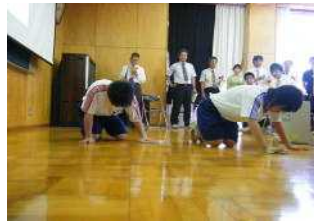
三郷中による掃除の実演