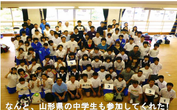
なんと、山形県の中学生も参加してくれた!

午前中のトイレ掃除は、素手でやるのはあまり抵抗がなかったけど、中学では初めてトイレ掃除をしたので、色々迷った。あまり汚れはなかったけど、水がたまっている所の黒ずんだ所が落ちにくくて疲れた。だんだんと周りとかどうでもよくなって、休憩の時間がイヤだった。早く掃除がしたかった。かなりハマってた気がする。すごい無心な状態だった。この落ち着いている時間が何か好きになった。もう少し長い時間やっていたいって気持ちが、終わりに近づくにつれて大きくなっていった。