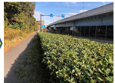
(左) Before、(右) After

【感想発表から】 「とにかくゴミの量が多い」「想像以上のゴミにびっくり」との感想を複数の方からいただきました。昨年末からのゴミの増え方に私も仰天しました。年末に出た家庭ゴミが不法投棄されたのでしょうか。興味深かったのは、新春のためか、大田市場西門を入ると中はきれいなものでした。清掃業者と中で働く人は別人なんだろうと思いました。「来月どうなっているか楽しみ」との感想も。一年の変化を追うことも楽しみの一つですね。「手にするもの戻込みするようなゴミも多数」あったとのこと。尿が入れられたペットボトルやビニール袋も投げ捨てられていましたね。処理していただき、ありがとうございます。「散歩の方が『ああ、きれいだな』と感じて、それが