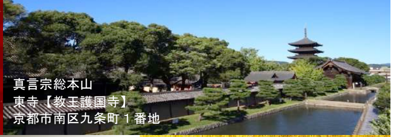
真言宗総本山 東寺【教王護国寺】 京都市南区九条町1番地