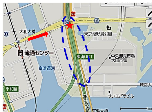
集合場所(★:ガード下) 掃除場所(青丸)

多くの野鳥や植物のある美しい公園。自然一杯の場所の清掃で充実した時間を過ごしませんか。