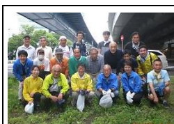
16 回 2017.7.2