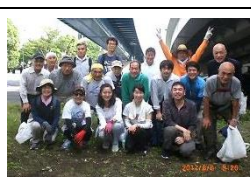
17 回 2017.8.6