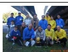
20 回 2017.11.5