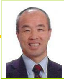
大会実行委員長 ごあいさつ